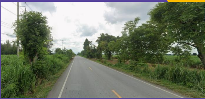
ภาพจำลองถนนโครงการ หลังปรับปรุงเป็นถนนมาตรฐานงานทางชั้นพิเศษ แบบ 4 ช่องจราจร